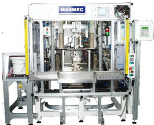
Tavola rotante di montaggio, avvitatura e prova tenuta finale sul componente assemblato.