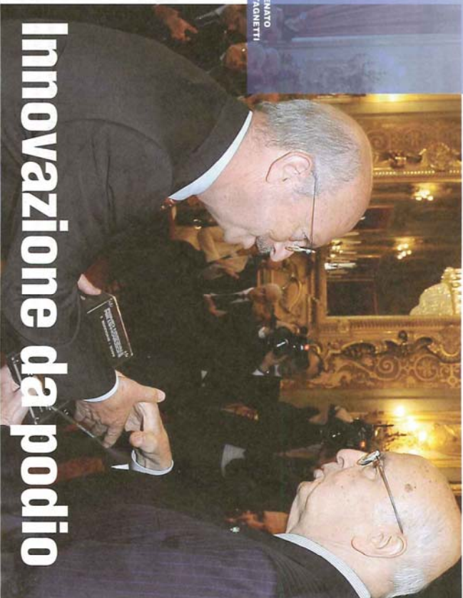
di RENATO CASTAGNETTI